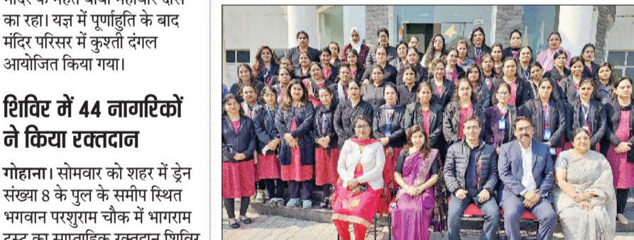
बच्चों को साइबर सुरक्षा बारे जागरूक करना जरूरी