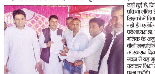
सोनीपत। हुकटा के प्रतिनिधि मंडल ने सांसदों-विधायक को सौंपा झण्डा।