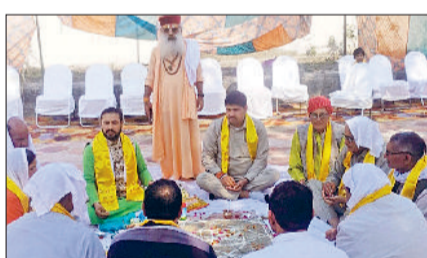
तानपुर में सनातन शिक्षा गुरुकुल व गोवंश उपचार केंद्र के लिए भूमि पूजन