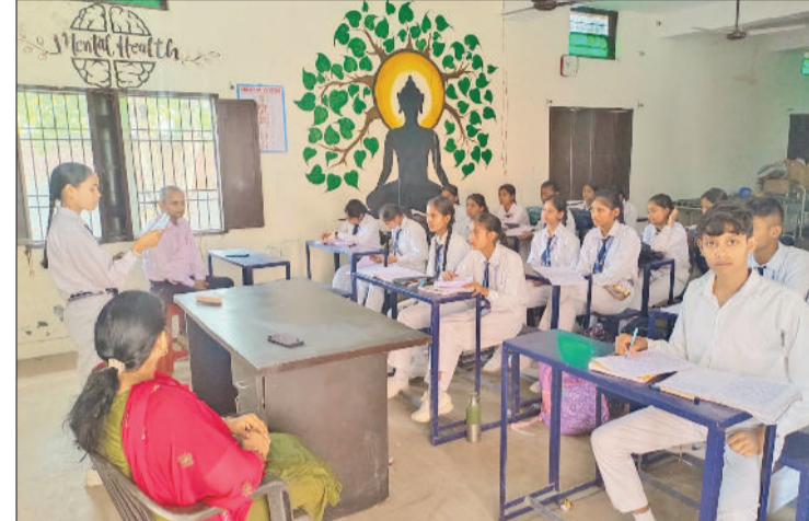
सोनीपत। मॉडल टाउन के राजकीय मॉडल संस्कृत विद्यालय में परीक्षा को लेकर तैयारी करते विद्यार्थी।

केंद्रीय माध्यमिक शिक्षा बोर्ड (सीबीएसई) की ओर से सोनीपत में बनाए गए 33 केंद्रों पर 17 फरवरी मंगलवार से कक्षा 10वीं व 12वीं के करीब 20800 परीक्षार्थी परीक्षा में शामिल होंगे। दसवीं में सुबह साढ़े दस से दोपहर 1:30 बजे तक गणित स्टैंडर्ड व गणित बेसिक की परीक्षा होगी। 12वीं में सुबह साढ़े दस से दोपहर 1:30 बजे बायोटेक नो लॉ जी, इंटरप्रन्योरशिप की परीक्षा है। इस साल सीबीएसई की परीक्षा देने वाले परीक्षार्थियों की संख्या में भी इजाफा हुआ है। जिला शिक्षा विभाग की ओर से परीक्षा को लेकर केंद्रों पर अभी से सुरक्षा के कड़े प्रबंध किए गए हैं। बोर्ड ने अधिकांश परीक्षा केंद्र शहरी क्षेत्र में बनाए हैं। जहां परीक्षार्थियों को गेट पर प्रवेश पत्र दिखाकर केंद्र में प्रवेश मिल पाएगा, वहीं परीक्षा केंद्रों में सीसीटीवी के माध्यम से परीक्षार्थियों पर नजर रखी जाएगी। इस वर्ष परीक्षार्थियों की सुविधा के लिए क्षेत्र अनुसार आसपास 3 नए परीक्षा केंद्र स्थापित किए गए हैं। सीबीएसई की ओर से राई व कुंडली क्षेत्र के लिए सनराइज स्कूल, तो गन्नौर खंड में बाल भारती स्कूल में केंद्र बनाया गया है। इसके अलावा गोहाणा क्षेत्र के विद्यार्थियों की सुविधा के लिए नवोदय विद्यालय में परीक्षा केंद्र स्थापित किया गया है।