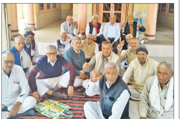
सोनीपत। बैठक के दौरान उपस्थित एसोसिएशन के पदाधिकारी एवं सदस्यगण।