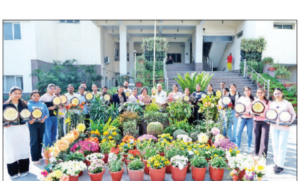
सोनीपत। जीवीएम गर्ल्स कॉलेज ने विजेता विद्यार्थियों के साथ प्राचार्य एवं अन्य।