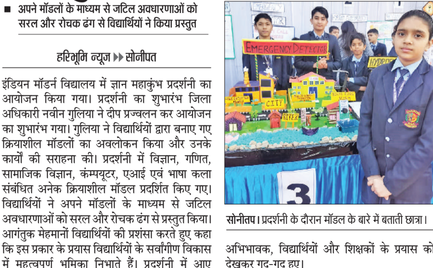
सोनीपत। प्रदर्शनी के दौरान मॉडल के बारे में बताती छात्रा। अभिभावक, विद्यार्थियों और शिक्षकों के प्रयास को देखकर गद-गद हुए।